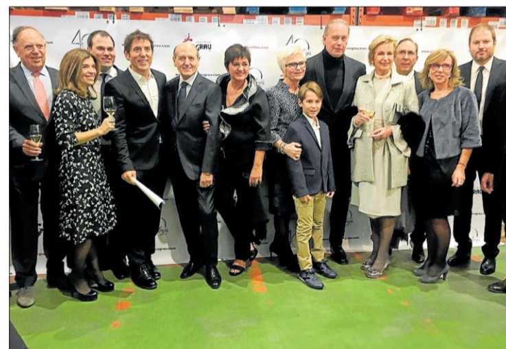
L'empresa va estrenar ahir els nous espais amb una festa. DdG

Grau ha invertit en el sistema de magatzem robotitzat Mini-